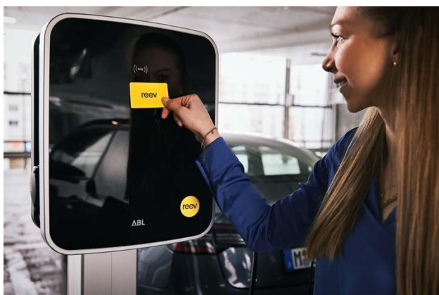
Laden am Bundle Compact