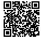
Teltonika Router RUT241

QR-Code scannen/klicken und Installationsprotokoll herunterladen