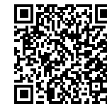
Stromzähler TQ EM420